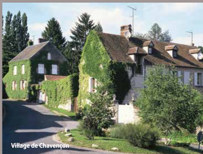
Village de Chavençon