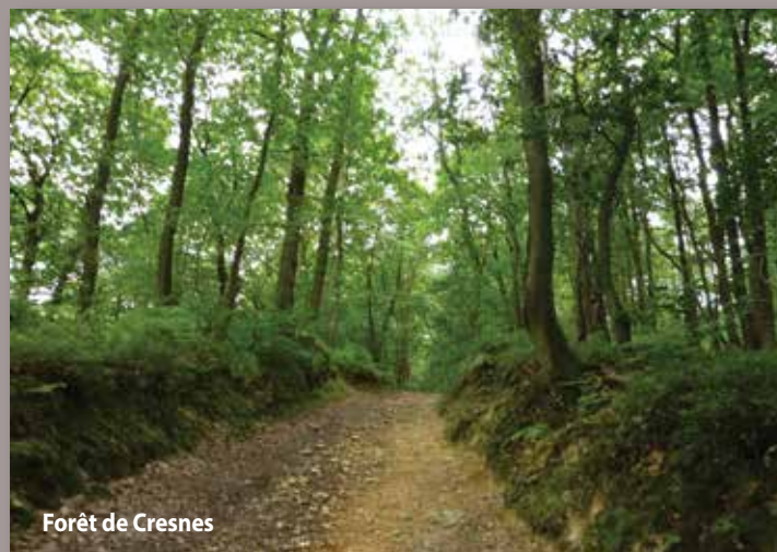
Forêt de Cresnes